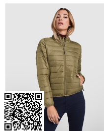
FINLAND WOMAN RA5095