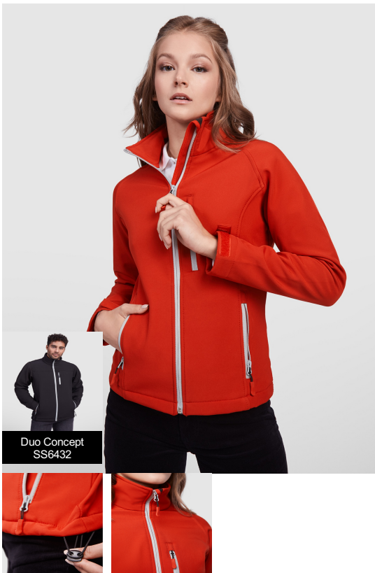
Duo Concept SS6432