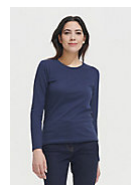
SOL'S Imperial LSL WOMEN 02075