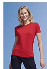
SOL'S Imperial WOMEN 11502