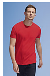
SOL'S Imperial 11500