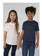
SOL'S REGENT KIDS 11970