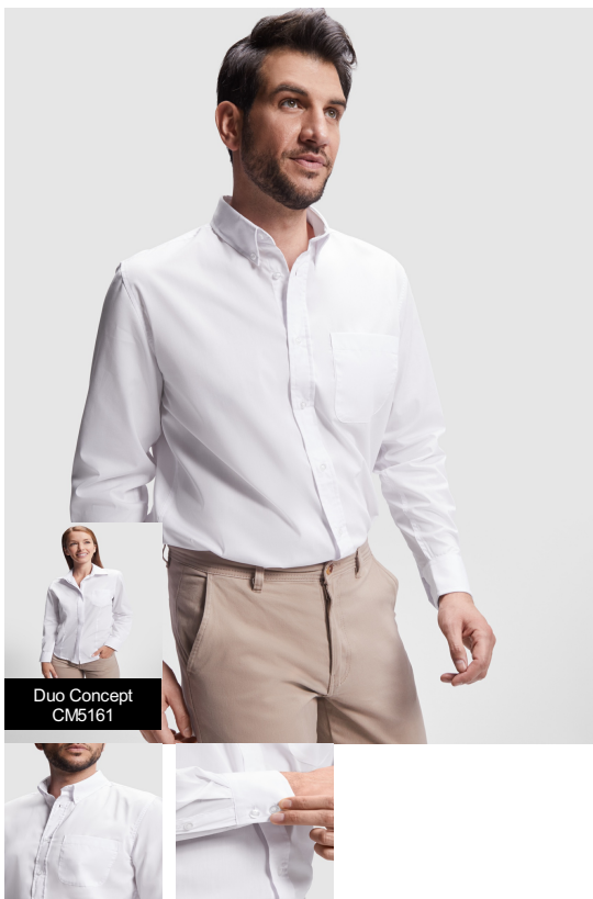
Duo Concept CM5161