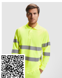
POLARIS L/S HV9306