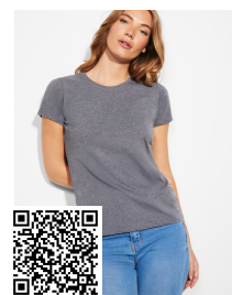
FOX WOMAN CA6661