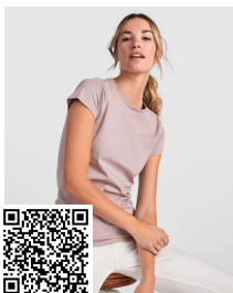
BREDA WOMAN CA6699