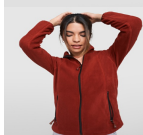
Duo Concept SM1196