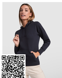
URBAN WOMAN SU1068