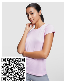
MONTECARLO WOMAN CA0423