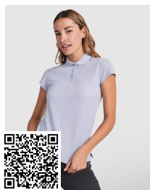
STAR WOMAN PO6634